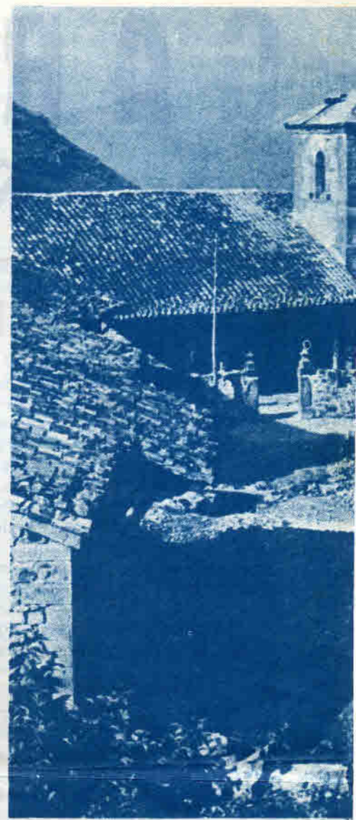
"Un rincón de San Sebastián de Ga

En la misma línea —añadimos nosotros— trascendió el marco del último pleno de la Conferencia Episcopal española, el hecho de que, ante la insistencia para que el Pleno en tanto que representación genuina de la Iglesia Jerárquica de España se pronunciara en forma condenatoria sobre Garabandal, hubo de levantar su voz pública y oficialmente el Ordinario de una diócesis alejada geográficamente de Santander, para afirmar que "él se opondría a la aprobación de dicha propuesta, dado que personalmente creía en el origen sobrenatural de las apariciones de Garabandal".