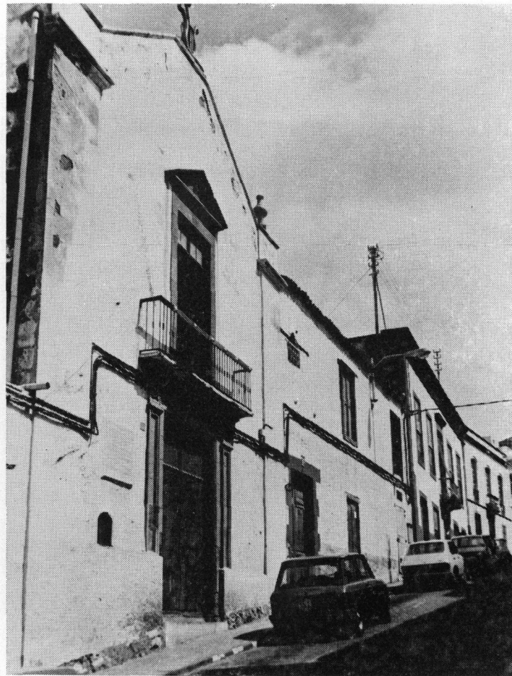
Fachada del hospicio de Santa Catalina de Siena en Guía de Gran Canaria. En primer plano la ermita.