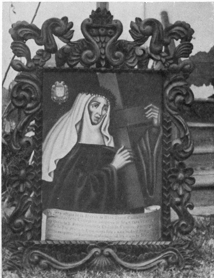
Copia del retrato original de Sor Catalina de San Mateo realizada por Manolo Millares. El marco, labrado por Plácido Fleitas.