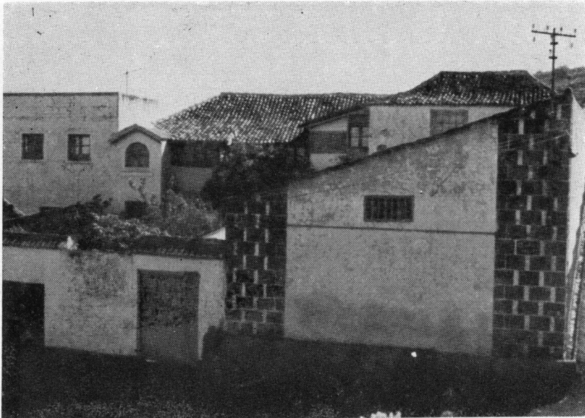
Hospicio de San Juan Evangelista en La Matanza de Acentejo. Tenerife. Se ve la pequeña ermita.