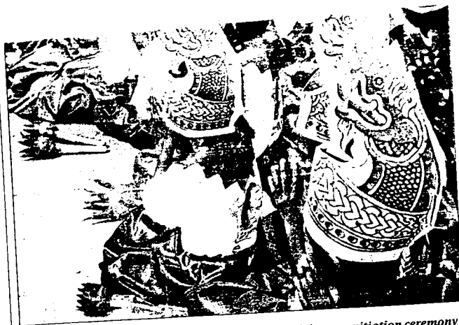
Children, wearing replicas of naga on their heads, join a propitiatory ceremony with people of Phon Phisai district, Nong Khai, at Wat Thai temple. The ceremony was held yesterday ahead of the much-expected fireball phenomenon last night.

M. Pawlicki nous fait part d'une information étonnante (et supérieurement intéressante) qu'il a relevée dans le Bangkok Post du 10 octobre 2003 :