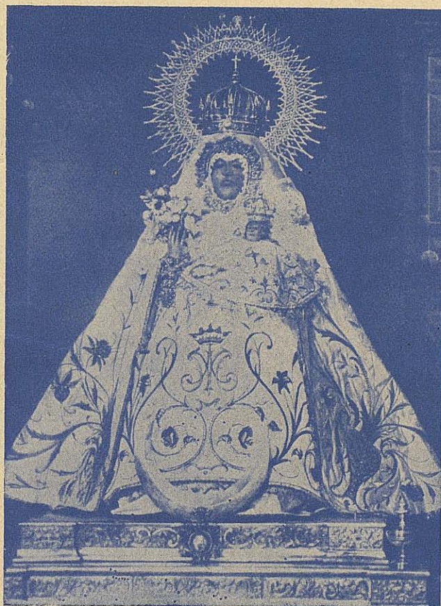
Nuestra Señora de San Lorenzo, de Valladolid, a la que se dedica el Certamen de este año.

ANALES DE LA PONTIFICIA Y REAL ACADEMIA BIBLIOGRAFICO-MARIANA