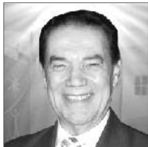
Divaldo Pereira Franco