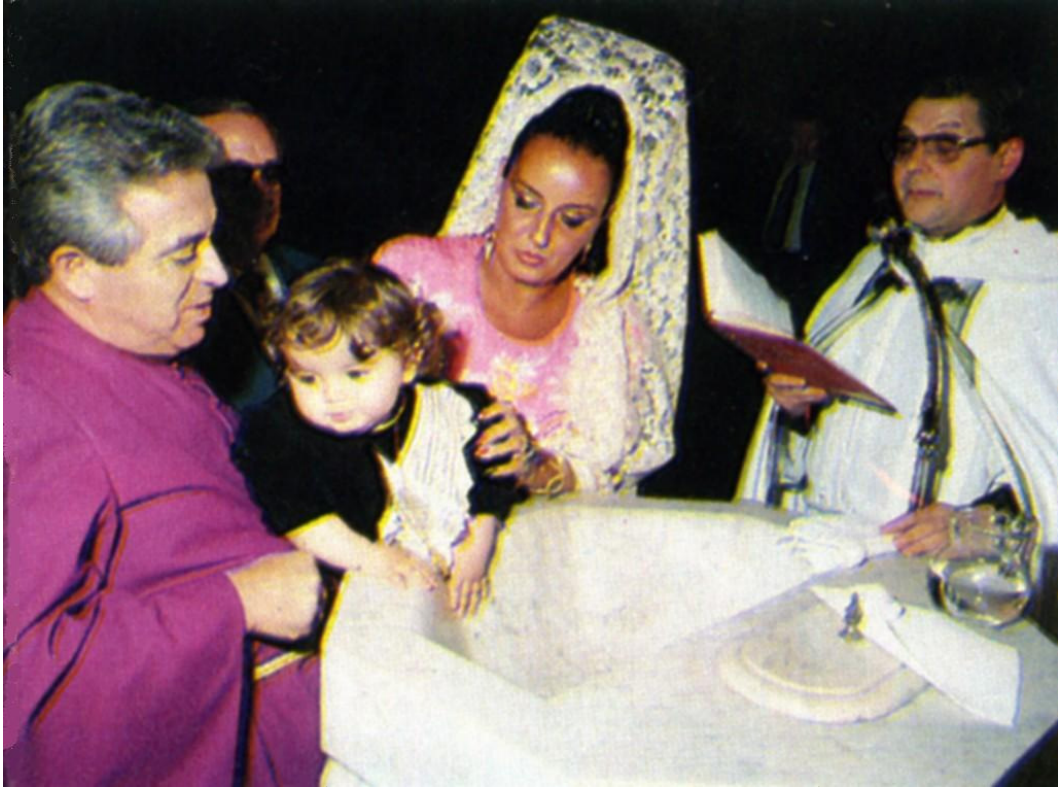
BAUTIZO DE JERUSALÉN, EN LA IGLESIA DE SANTA BÁRBARA (MADRID)